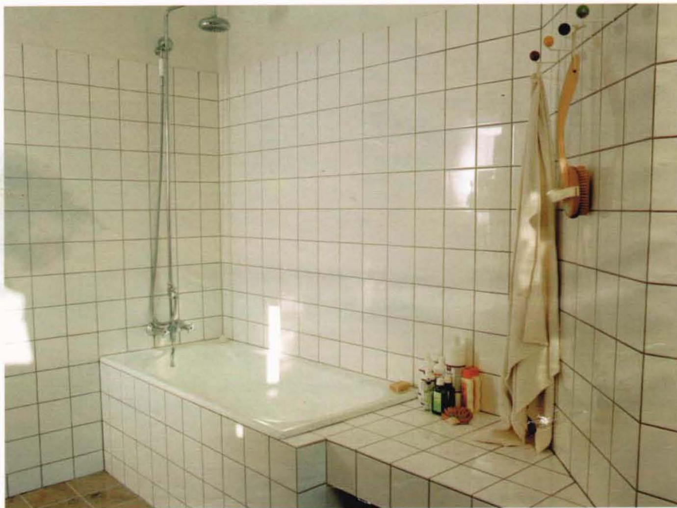
Badekarret er det eneste, der stammer fra den oprindelige lejlighed. Resten af badeværelset er renoveret i en stil, der passer til en gammel herskabslejlighed. Gulvet er belagt med kalkfliser.