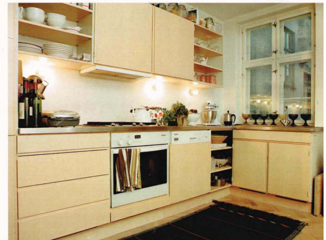
Køkkenet er fra Paustian, og belysningen er enkle pærer i porcelænsindfatninger. I vinduet står glas fra Marimekko, som spiller flot, når solen skinner i dem.