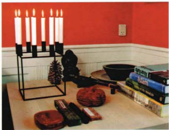
Det massive kvadratiske egetræsbord i et hjørne i stuen er et af de få møbler, Sofie Arctander Plum fik lov til at tage med, da hun flyttede ind.