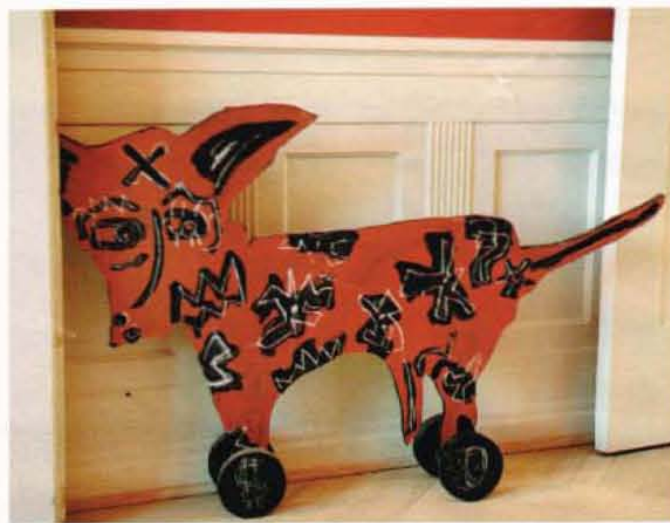
Den naivistiske hund er lavet af Sunny Asemonta.